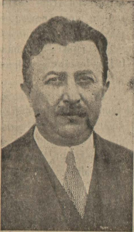
Dahiliye vekili Şükrü Kaya B.

"Başvekil paşa Hz. nin emirlerle Büyük Millet Meclisindeki son nutuklarında bahsettikleri yahudilerin Trakyadan İstanbulu grupça gelmeleri esbabını yerinde tetkik etmek üzere Trakya'ya gidiyorum. Bizim bildiğimize göre hadise bazı propagandalar yüzünden yahudilerin İstanbulu gelmeğe başlamışlardır. Hadisenin hakiki mahiyeti yerinde daha iyi görüleceği gibi her halde işin icap ettirdiği tedbirleri alacağım. hükümetime arzedeceğim.